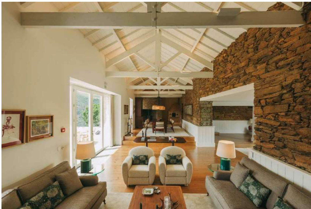
La Casa Grande et ses six chambres est idéale pour les familles et les groupes d'amis