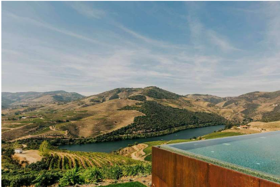
La Casa dos Cardanhos accueillait les travailleurs temporaires, et abrite désormais sept chambres