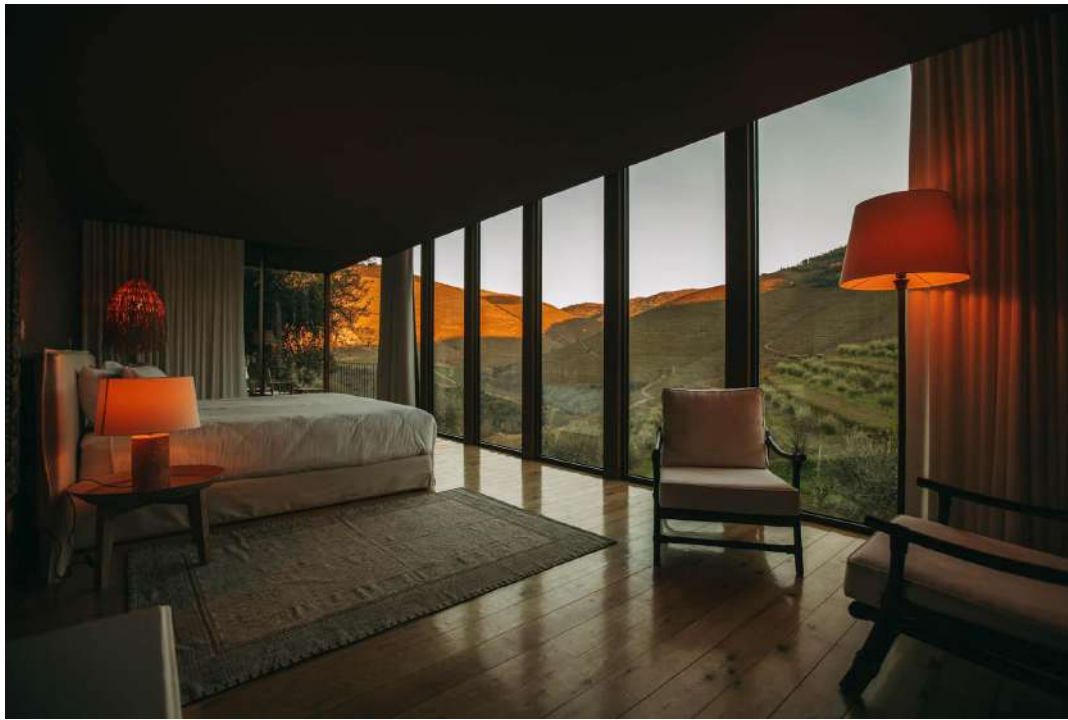
Vue imprenable sur la vallée du Douro