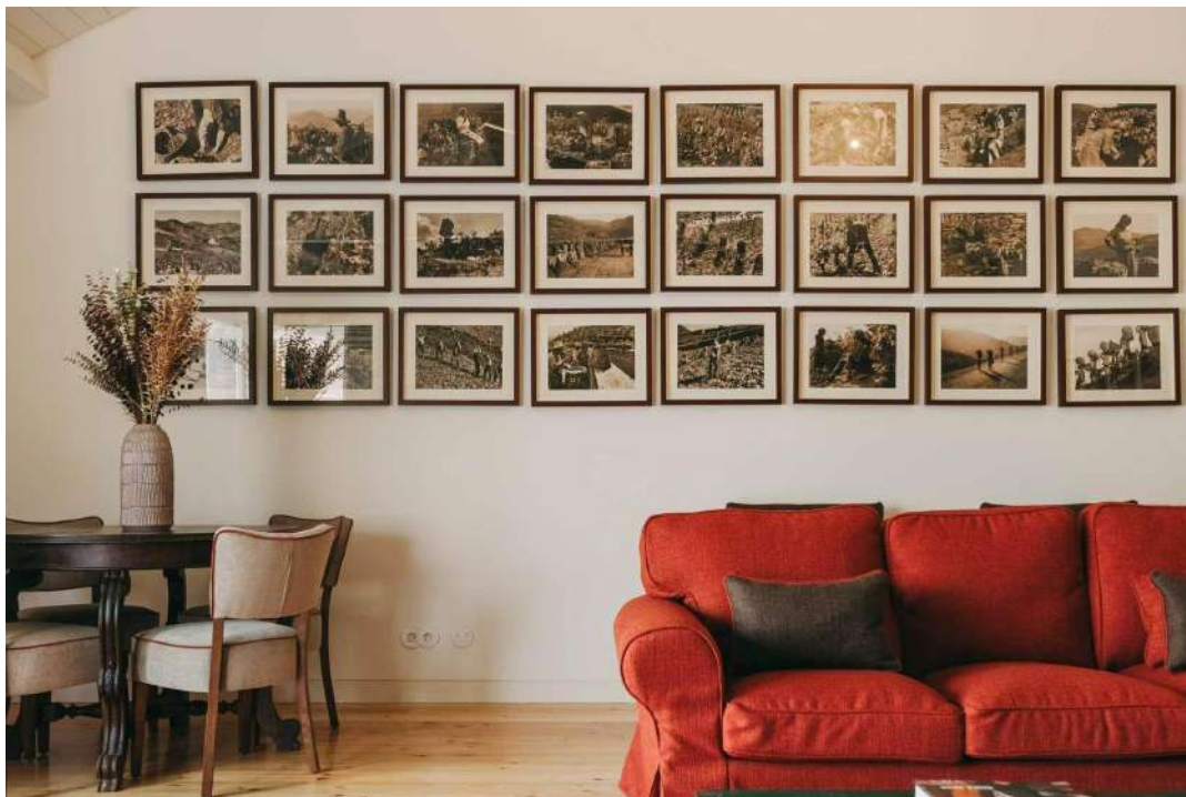
Dans chaque recoin de la propriété, des bulles où s'isoler et s'adonner au farniente