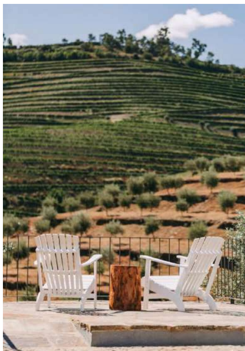
Le restaurant de la Quinta